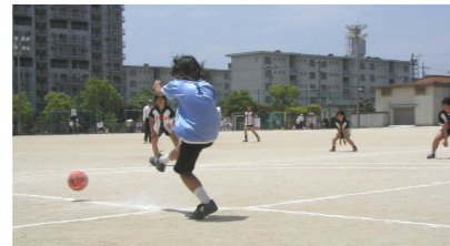
飛べ! 遠くへ(フットベースボール)