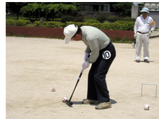
狙いを定めて...(ゲートボール)