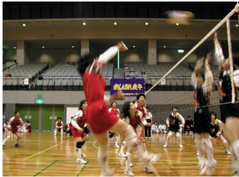
ナイスアタック!(バレーボール)