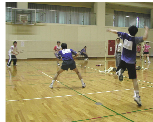
バドミントンは、古田学区が13年連続で19回目の優勝カップを手にした。