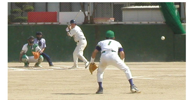
ソフトボールは、井口明神学区が7年ぶり3度目の優勝を果たした。

5月26日(日)、西区内において第23回西区民スポーツ大会が開催されました。広島サンプラザホールで開会式を行った後、区内の各スポーツ施設で10種目に各小学校区の代表総勢約1,300名が競いました。